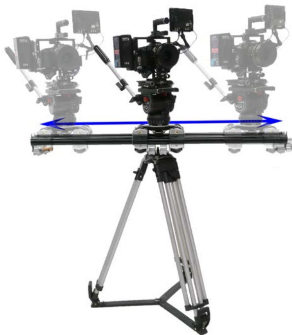
三脚 使用例 (120cmレールのみ使用可)