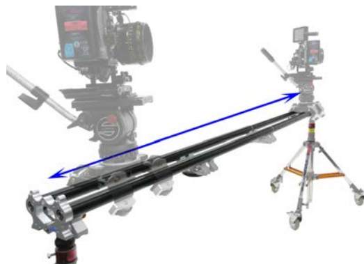
120cmと100cmレールの連結 使用例